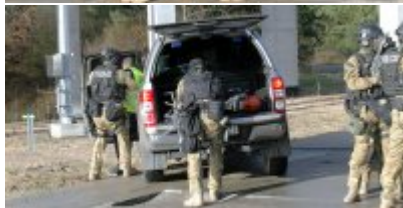
Uzbrojeni terroryści zaatakowali Terminal LPG w Świnoujściu - ćwiczenia służb