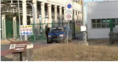
Uzbrojeni terroryści zaatakowali Terminal LNG w Świnoujściu - ćwiczenia służb