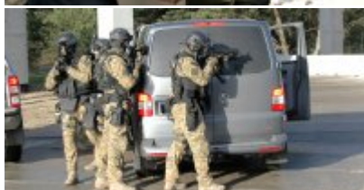
Uzbrojeni terroryści zaatakowali Terminal LPG w Świnoujściu - ćwiczenia służb