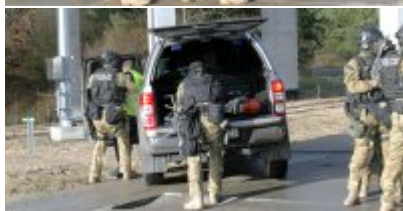
Uzbrojeni terroryści zaatakowali Terminal LPG w Świnoujściu - ćwiczenia służb