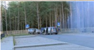
Uzbrojeni terroryści zaatakowali Terminal LNG w Świnoujściu - ćwiczenia służb