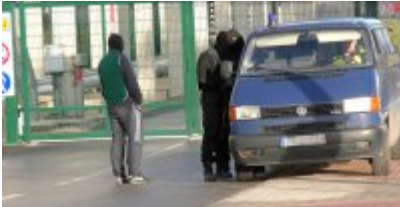
Uzbrojeni terroryści zaatakowali Terminal LNG w Świnoujściu - ćwiczenia służb