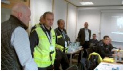
Uzbrojeni terroryści zaatakowali Terminal LPG w Świnoujściu - ćwiczenia służb