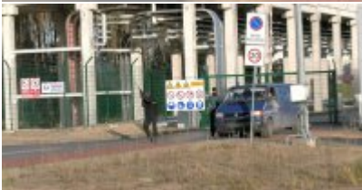
Uzbrojeni terroryści zaatakowali Terminal LNG w Świnoujściu - ćwiczenia służb