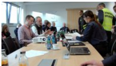
Uzbrojeni terroryści zaatakowali Terminal LPG w Świnoujściu - ćwiczenia służb