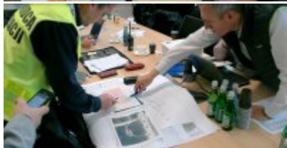
Uzbrojeni terroryści zaatakowali Terminal LPG w Świnoujściu - ćwiczenia służb