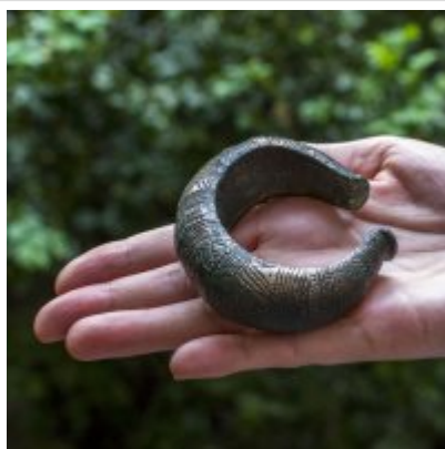
Bransoleta sprzed 3500 lat odzyskana