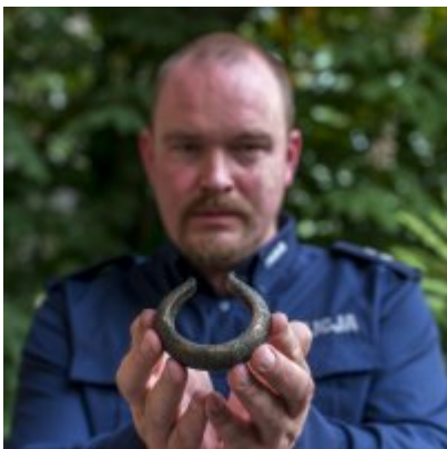
Bransoleta sprzed 3500 lat odzyskana