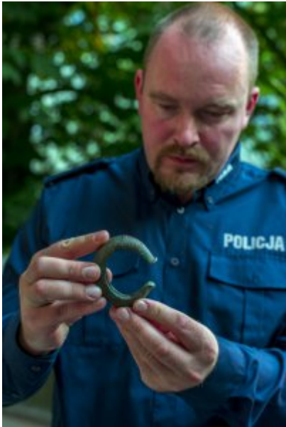
Bransoleta sprzed 3500 lat odzyskana